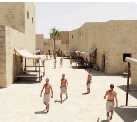
Ulice mezopotamskega mesta Ur so bile živahne, polne prodajalcev in kupcev.