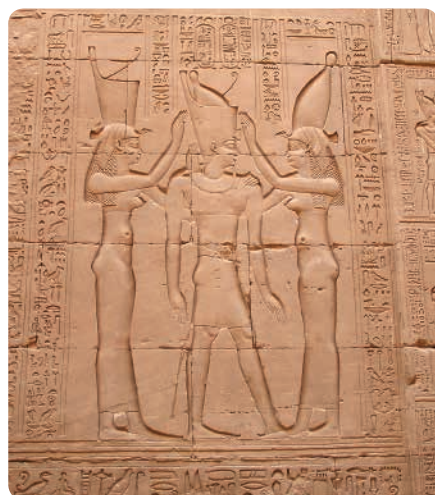
Faraon in boginji, tempelj Edfu, Egipt